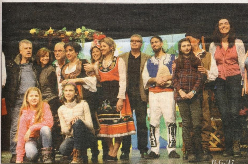
Театрална група „Зад Океана“ спечели сърцата на зрителите в Отава.